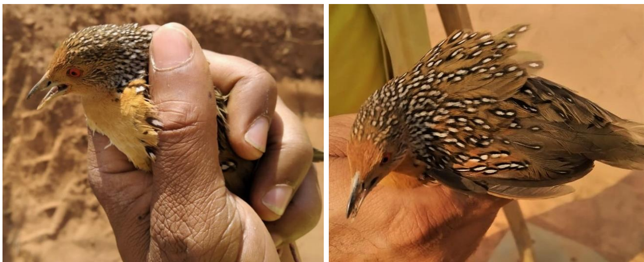
Figura 2. Indivíduo de Micropygia schomburgkii apanhado durante combate a incêndio florestal no entorno imediato da REVIS Veredas do Oeste Baiano.

aproximadamente oito indivíduos de M. schomburgkii , atordoadas com a fumaça, atravessando velozmente a estrada de terra que separava a pastagem exótica de Andropogon sp. em chamas e o capim agreste nativo ( Imperata brasiliensis cf.) do cerrado campo sujo adjacente. Um dos indivíduos, bastante debilitado, foi apanhado e afastado da cortina de fumaça (Figura 2), por JS e DC, e após cerca de 20 minutos, com restabelecimento dos sentidos, solto na área de cerrado não afetada pelo fogo onde se refugiaram os demais indivíduos.