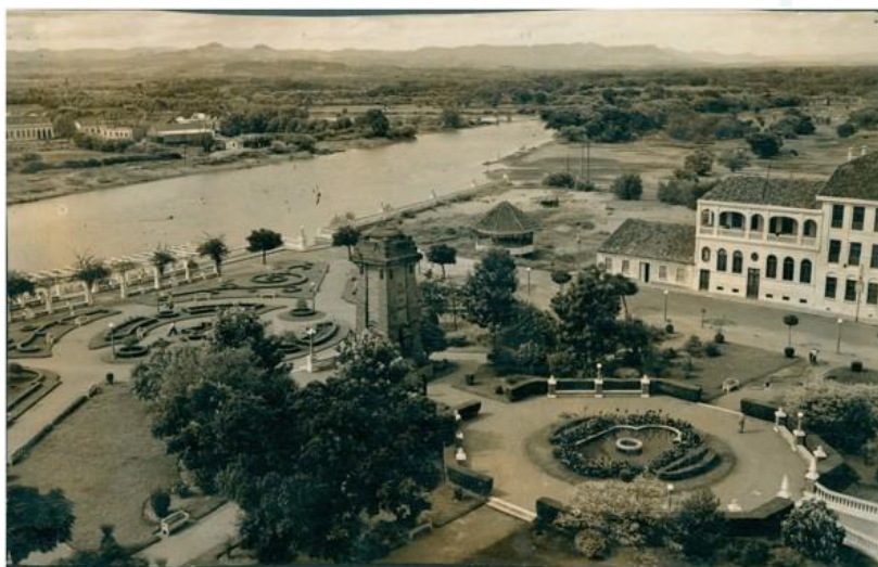
Fotografia 3 - Vista aérea: Praça do Imigrante, Rio dos Sinos e prédios da Escola Normal Evangélica