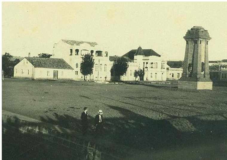
Fotografia 1 - Aterro com o monumento ao Imigrante e prédios ao fundo