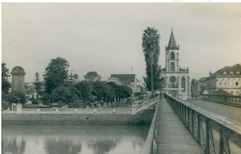
Fotografia 2 - Centro histórico de São Leopoldo/RS