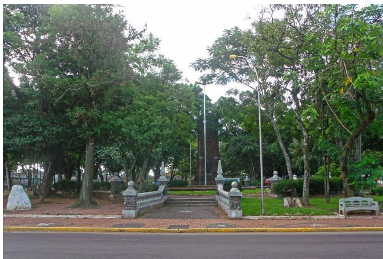
Fotografia 5 - O espaço arborizado da praça

muito sombreada e até mesmo escurecida em determinados horários do dia, dificultando, assim, a permanência do público no local. Soma-se a isso a falta de segurança pública, que fez com que a praça configurasse um ambiente pouco atrativo para a circulação e o convívio, conforme a fotografia 5 apresenta: