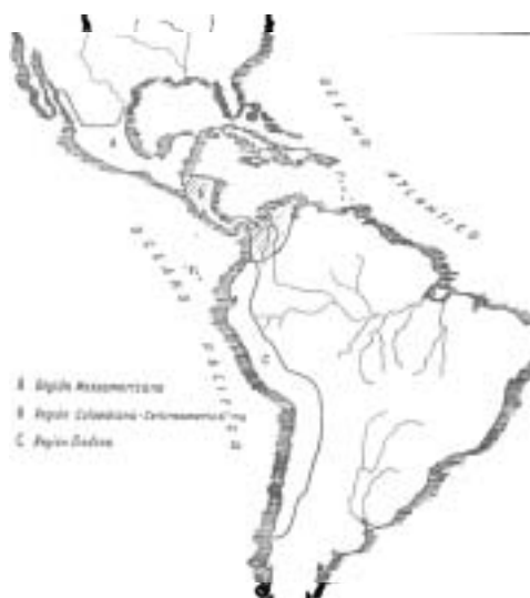
Mapa 03 - Área de dispersão das civilizações Americanas

Para estudo da formação dos povos americanos, se reconhece, na comunidade científica, em geral, a contribuição do antropólogo brasileiro Darcy Ribeiro. Com o intuito de elaborar um esquema do desenvolvimento das civilizações americanas, ele procedeu à revisão crítica das diversas teorias da evolução tecnológica, social e ideológica das diferentes sociedades humanas dos últimos 10 mil anos. Desta forma, o processo de desenvolvimento humano foi desdobrado em várias etapas correspondentes ao desencadeamento de sucessivas revoluções tecnológicas (agrícola, urbana, do regadio, metalúrgica, pastoril, mercantil, industrial e termo-nuclear), cujos efeitos se propagam através de um ou mais processos civilizatórios (conforme pode ser observado no quadro da página seguinte).