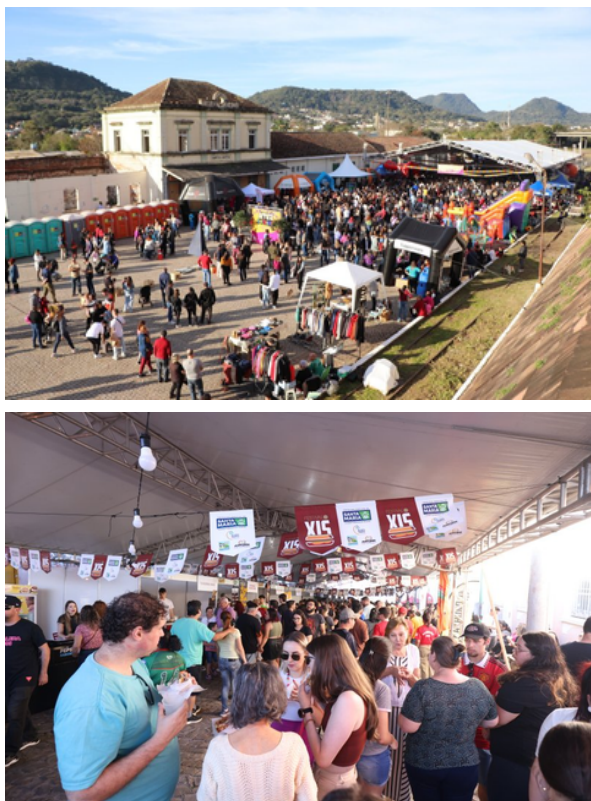
Figura 3 – (a) Evento realizado no largo da Gare; (b) Festival do Xis.