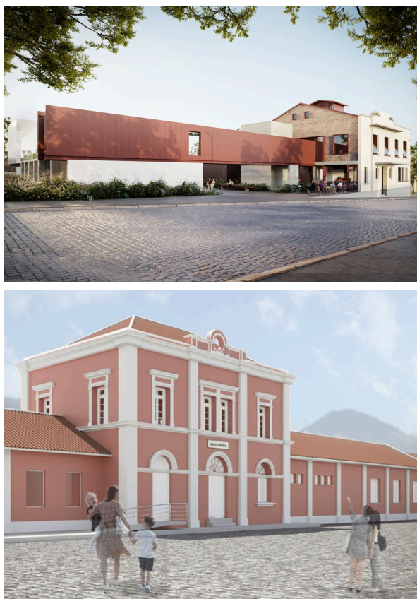
Figura 2 – (a) Associação dos Ferroviários - Iconicidades; (b) Projeto de revitalização da Estação Ferroviária.