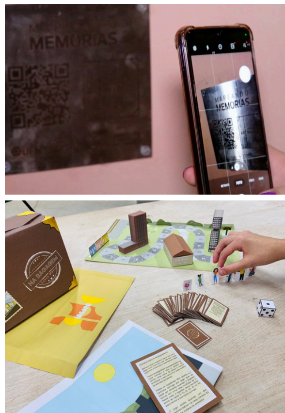
Figura 4 – (a) Projeto Mapeando Memórias; (b) Projeto Na Bagagem.

em junho de 2023, com onze delas já instaladas (Distrito Criativo Centro-Gare, 2023b).