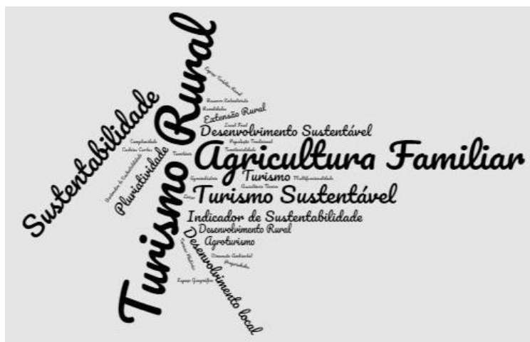
Figura 1 – Nuvem de palavras chaves da pesquisa

Na Figura 1, utilizou-se a nuvem das palavras-chaves como ferramenta de análise, identificando por meio desta, as palavras chaves predominantes e os conceitos e ideias expostas nas pesquisas.