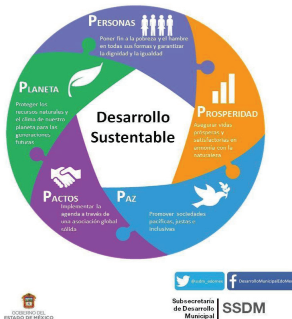
Figura 6 – Los Objetivos de Desarrollo Sustentable según las 5 “P” Disponível em: http://www.unesco.org/new/fileadmin/MULTIMEDIA/FIELD/Quito/pdf/Catedra_Desarrollo_Sostenible.pdf