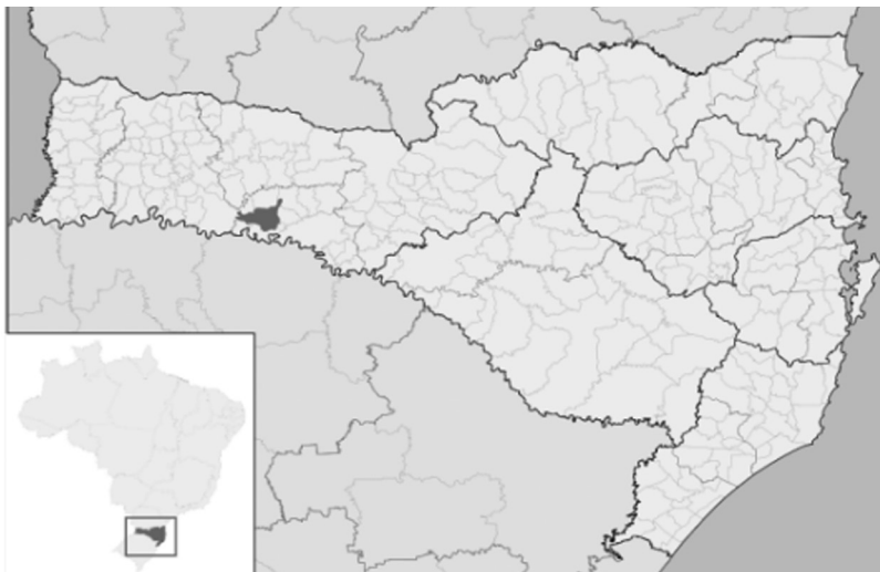
Figura 01 - Localização de Seara em Santa Catarina