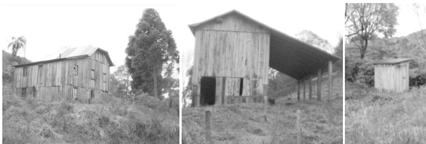
Figuras 03, 04 e 05 - Casa, Paiol/estábulo e casinha de banho (da esquerda para a direita)