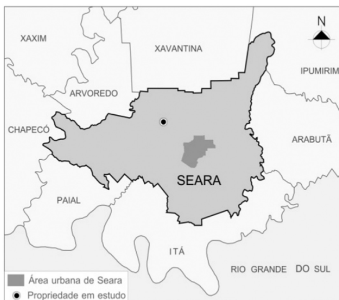
Figura 02 - Localização da propriedade em estudo