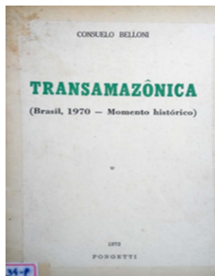
Figura 1 – Capa do livro Transamazônica (Brasil, 1970 – Momento histórico) .

não deve e não pode ser subjugada, mas analisada dentro de uma produção literária peculiar que emite um ponto de vista do momento histórico.