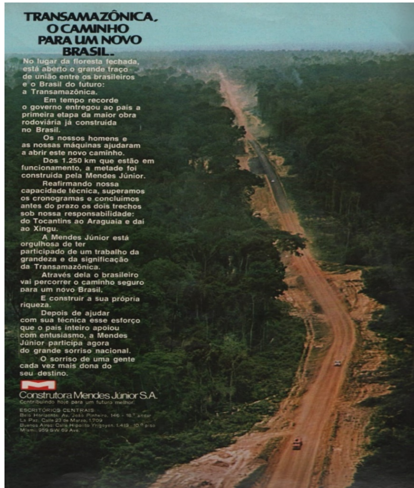
Figura 2 – Transamazônica, o caminho para um novo Brasil.

Além da imagem, que já demonstra o simbolismo indagado, esta publicidade da Construtora Mendes Júnior expressa na mensagem conjunta, os termos dispostos nos versos do poema de Belloni. No título, Transamazônica, o caminho para o Progresso do Brasil , segue a mesma linha de significados e também já na primeira frase (“no lugar da floresta fechada está aberto o grande traço de união entre os brasileiros e o país do futuro: a Transamazônica”) deixa de forma ainda mais evidente a ideia da justificativa do tombamento das árvores para a integração e prosperidade da nação.